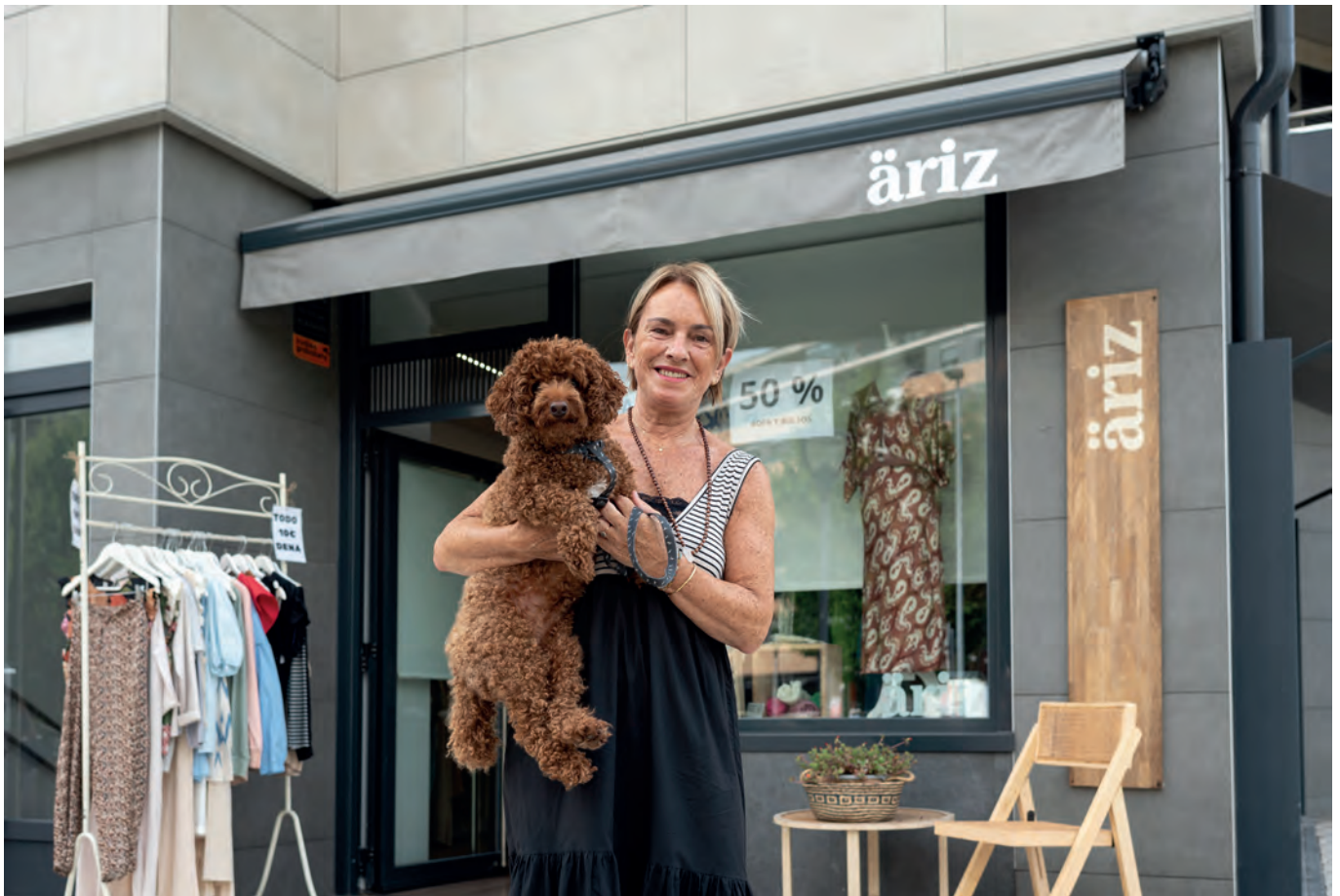
Ariz, arropa eta osagarri denda.

Aurreko urtean egindako herri-gogoetak agerian utzi zituen herritar zein eragileen kezkak. Horren aurrean, Astigarragako Udalak hainbat ekintza burutuko ditu.