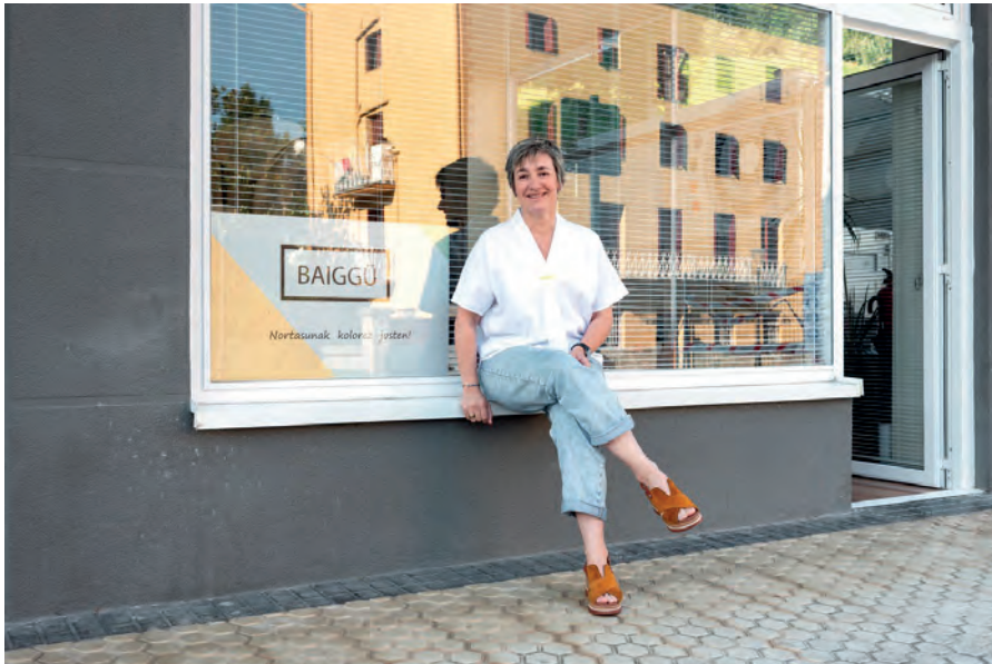
Baiggü, behar bereziak dituzten pertsonei zuzendutako ehungintzako produktuen eta edonorentzako osagarrien diseinu, ekoizpen eta salmenta.