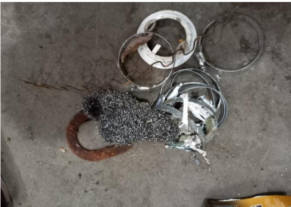
ACERO NO ENVASE