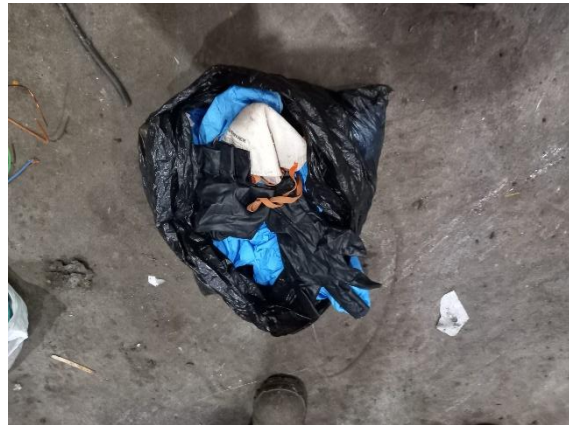
RESTO DE HOSPITAL