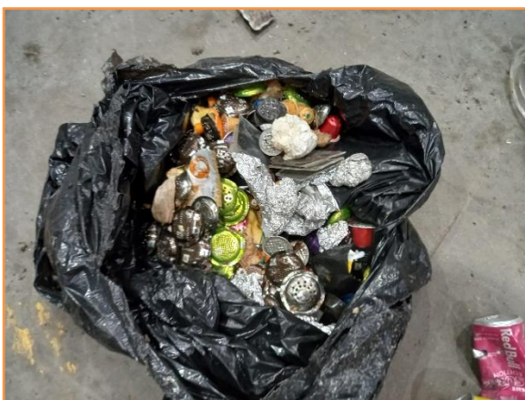
ALUMINIO NO ENVASE