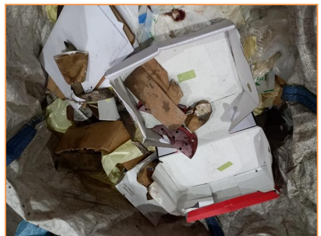
PAPEL SIN PUNTO