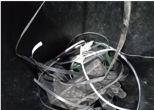
RESTO DE PLASTICOS