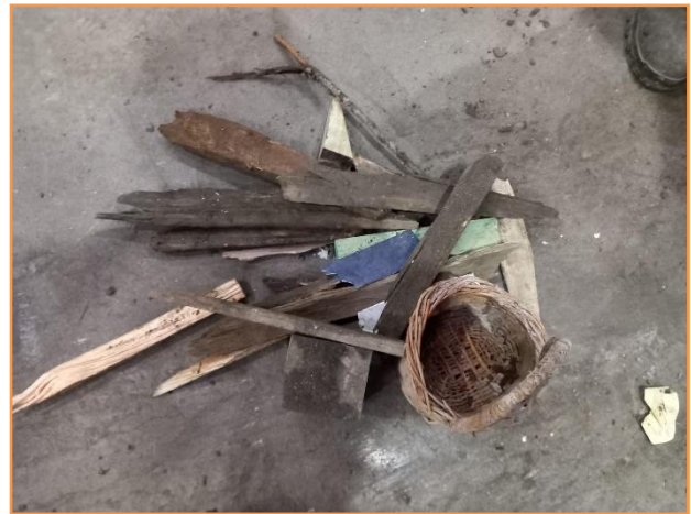
MADERA NO ENVASE