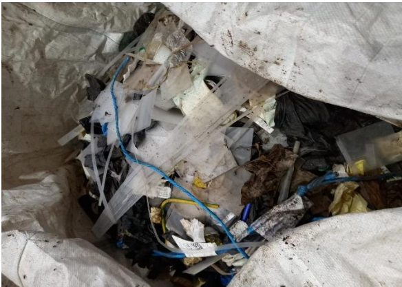
PLASTICO NO ENVASE