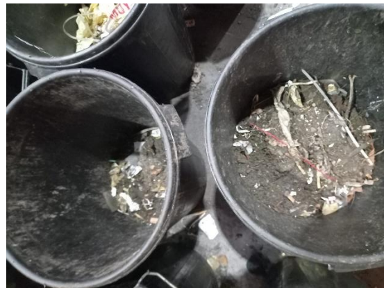
RESTO DE PODAS