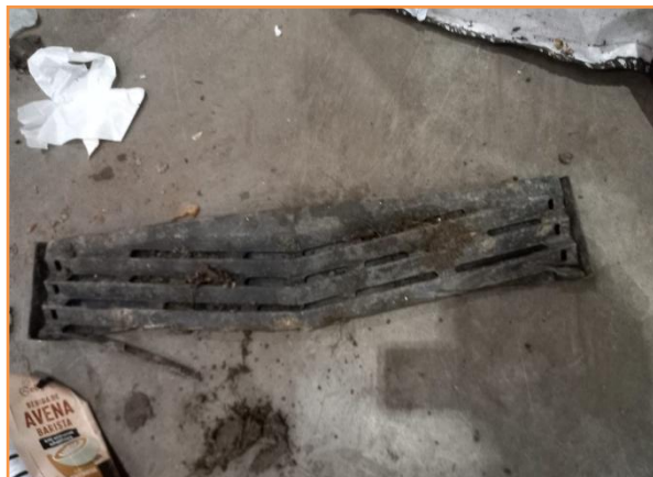
RESTO DE VEHICULO