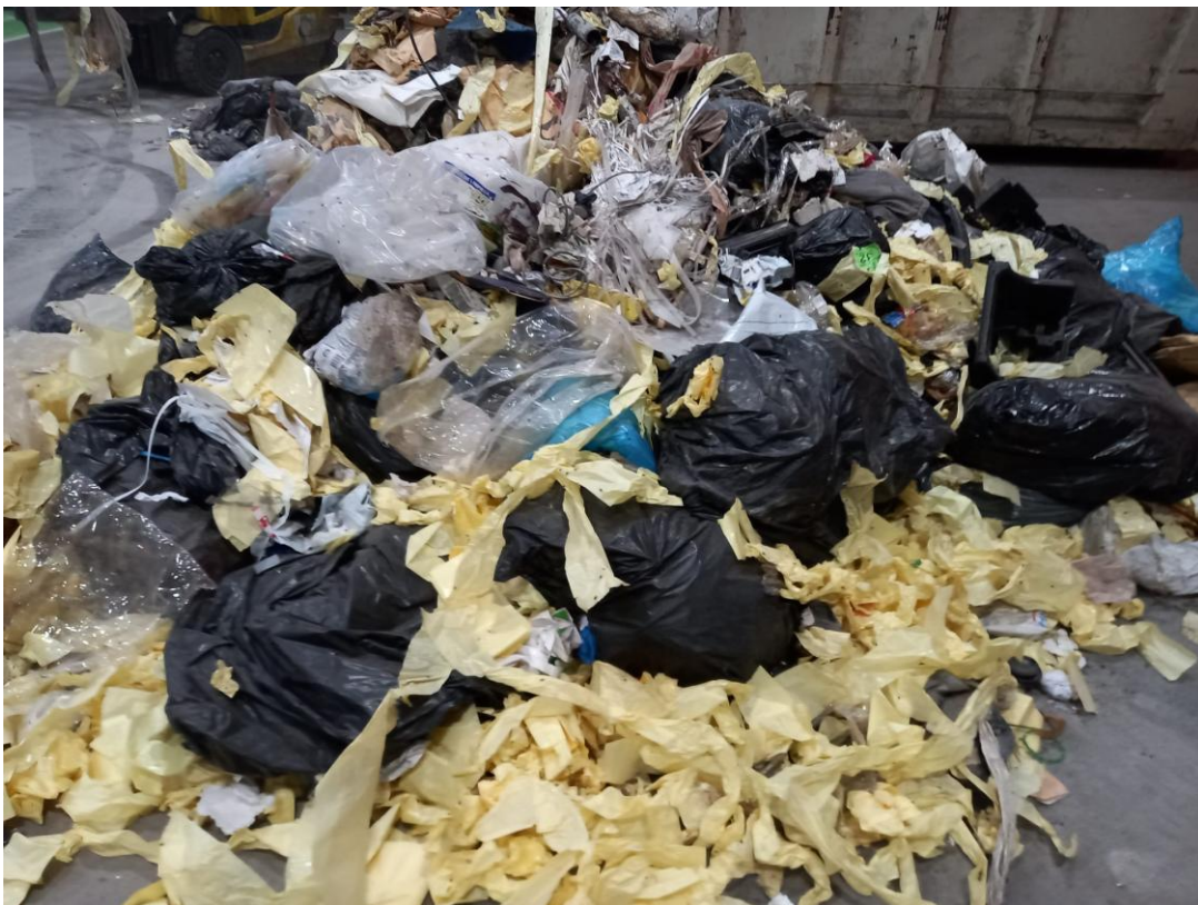
Disposición inicial de los residuos objeto de estudio

El proceso de caracterización consiste en obtener la composición en tanto por ciento en peso de dicha muestra, mediante la clasificación, concentración y peso de los diferentes componentes y categorías.