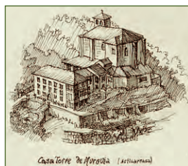
Casa Torre de Murguía (Arturman)

La primera "Jornada de Paisaje y Territorio. Hacia una reflexión a través de la planificación" se desarrollará el día 26 de enero de 2018, entre las 10.00 y las 20.00 horas, en el Palacio de Murguía , situado en la Kale Nagusia 15 , en el municipio de Astigarraga (Gipuzkoa).