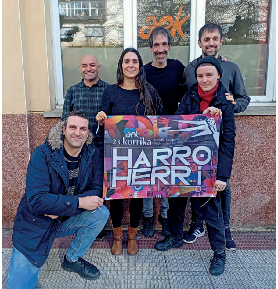
Astigarragako AEK-ko irakasleak

Baina AEK ez da soilik euskarazko ikastaroak ematen dituen erakundea. Euskararen normalizazioan eragiten duten faktore desberdinekin lan egiten du hainbat proiektuen bidez, hala nola, Mintzapraktika egitasmoak, aholkularitza zerbitzua eta euskara sustatzeko proiektuak.